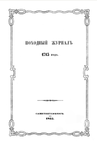
Походный журналъ 1715 года: Журналы 1715-го года. Титулъ