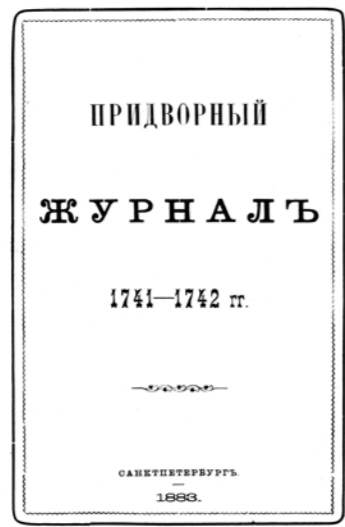
Придворный журналъ 1741–1742 гг., алфавитный указатель къ придворному журналу 1741–1742 гг. Титулъ

Во время тяжелейшего Азовского похода царь Петр Алексеевич поручил Государева двора подьячему, впоследствии главе Кабинета его императорского величества, тайному кабинет-секретарю, трудолюбивому и преданному А. В. Макарову (1675–1750) вести «юрнал или поденные записки» обо всем, что происходит с царем и вблизи него. Первая запись появилась 6 мая 1695 г., когда царь во главе основного войска приближался к стенам турецкой крепости. Вслед за Макаровым тексты «юрнала» писались разными лицами. Одни записи удивительно красочны, легко читаются, другие скучны и корявы, почерк неразборчив, встречаются явные пропуски, но все чрезвычайно интересно. Каждая запись проверялась Петром I и правилась его рукою. На черновых листах имеются также пометы генерал-аудитора барона