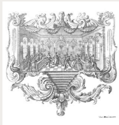
Обстоятельное описание торжественныхъ порядковъ благополучнаго вшествія въ царствующій градъ Москву и священнѣйшаго коронованія Ея Августѣйшаго Императорскаго Величества Императрицы Елисаветъ Петровны Самодержицы Всероссийския, еже бысть вшествіе 28 Февраля, коронованіе 25 Апрелья 1742. Между страницъ 170 и [171] рисункъ, гравированный на мѣди

Ряд важнейших событий, происходивших вблизи трона и даже в отдалении от него, умышленно не запечатлены на страницах журналов. Не следует искать упоминаний о дворцовых