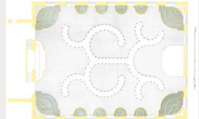
Журналы камеръ-фурьерскіе, 1753 года: Гофъ-штабъ-квартирмейстерскій и камеръ-фурьерскій церемональный, банкетный и походный журналы, 1753 года, во время пребывания Высочайшаго Двора въ Москве. Между страницъ 36 и 37 планъ залы

переворотах, Великой французской революции. Нередко монархи вводили камер-фурьеров в заблуждение, сообщая им неверные сведения. Так поступал Александр I, отправляясь к возлюбленной, и не он один. Но того, что можно почерпнуть из журнала, вполне достаточно для оценки этого ничем незаменимого массива сведений. Многие события нашей истории уточняются по камер-фурьерским журналам, выявляются побудительные мотивы свершившихся событий, тайные причины заключения секретных договоров, мысли монархов при назначении высших администраторов и дипломатических представителей.