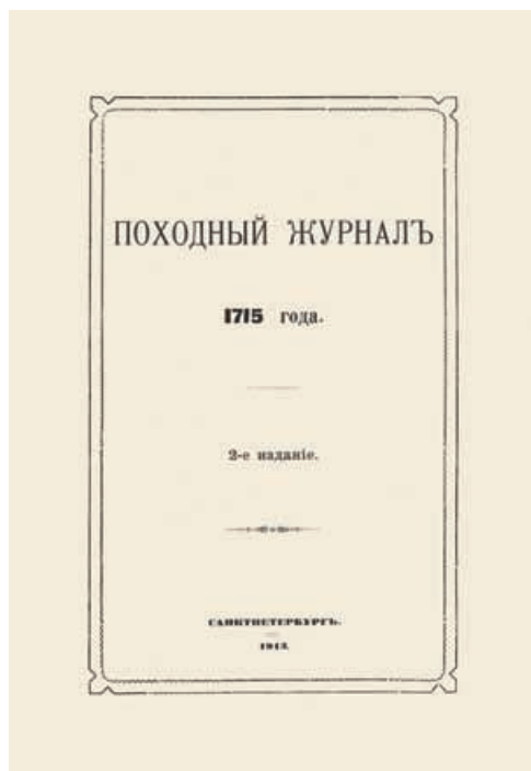
Походный журнал 1715 года. СПб., 1913. Титульный лист.

когда Екатерина I решила издать «поденные записки». Пётр I, самый энергичный из русских монархов, часто предпринимал отдалённые административные и дипломатические поездки, длительные военные походы. Всегда и везде его сопровождало лицо, обязанное вести «поденные записки». С каждым годом они приобретали всё большую историческую ценность, со временем обнаружилось, что многие сведения зафиксированы только в них.