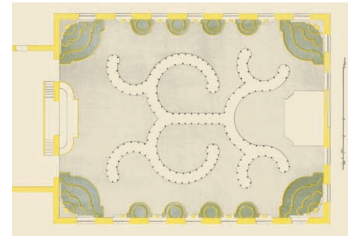
Журналы камер-фурьерские, 1753 г.: План залы.

Уникальная ценность и недоступность Камер-фурьерского журнала побудили издательство «Альфарет» вос-