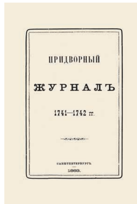
Придворный журнал 1741–1742 гг. СПб., 1883. Титульный лист.

В Табели о рангах должность камер-фурьера перемещалась с 9-й до 6-й ступенек, что соответствовало воинским чинам от капитана до полковника. Его служба складывалась из массы обязанностей — от наблюдения за чистотой и