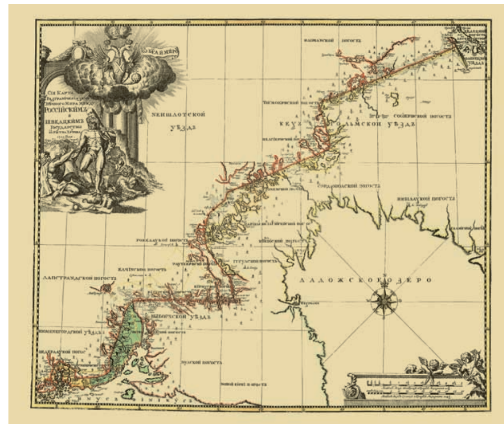
Карта русско-шведской границы, 1724 г. На карте изображена полоса территории шириной около 7 км от Финского залива до границы Олонецкого уезда вокруг новой границы между Россией и Швецией, установленной по Ништадтскому миру 1721 г.

К началу 1726 г. в Сенате постепенно накопилось значительное число карт и