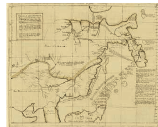
Рукописная карта Камчатки и сопредельных стран, 1724 г.