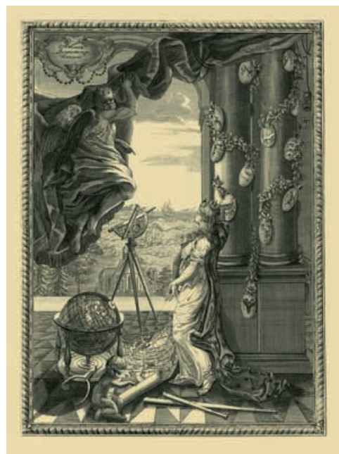
Фронтистис «Атласа Всероссийской империи» (1734 г.).