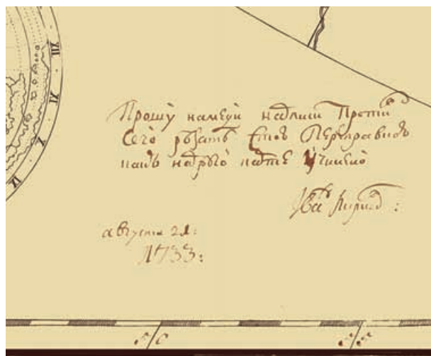
Собственноручная помета И.К. Кирилова на корректурном экземпляре Генеральной карты Российской империи: «Прошу на медь надписи против сего резать с тою переправкою, как на другой карте учинено, Иван Кирилов, августа 21 1733».

В течение последующих лет ему удалось подготовить и издать 22 карты отдельных территорий России. В 1733 г. Кирилов закончил работу над первым вариантом Генеральной карты Российской империи и затем передал гравированный корректурный экземпляр «для освидетельствования» в Академию наук.