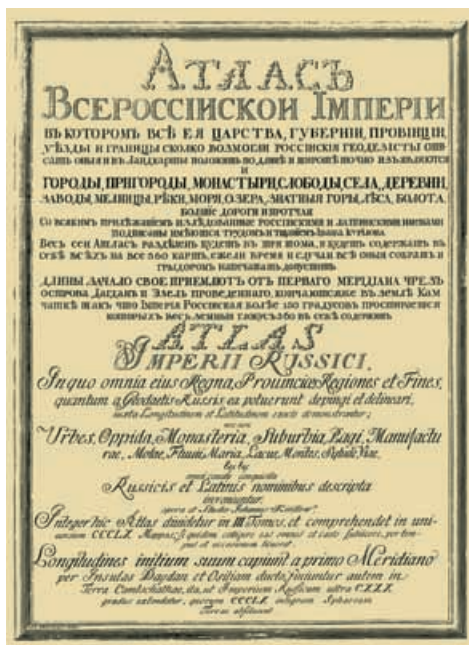
Титульный лист «Атласа Всероссийской империи» (1734 г.).

Одним из крупнейших замыслов Петра I было составление точной географической карты всего Российского государства. Во время своих путешествий по Европе в конце XVII и начале XVIII века Пётр мог убедиться, что в этом отношении Россия очень сильно отстала от своих более просвещённых соседей. Обширнейшая территория России в это же самое время была представлена лишь на рукописных, далёких от истинной точности картах. Поэтому для составления точной географической карты страны в 1721 г. указом Петра I была объявлена первая государственная геодезическая съёмка России.