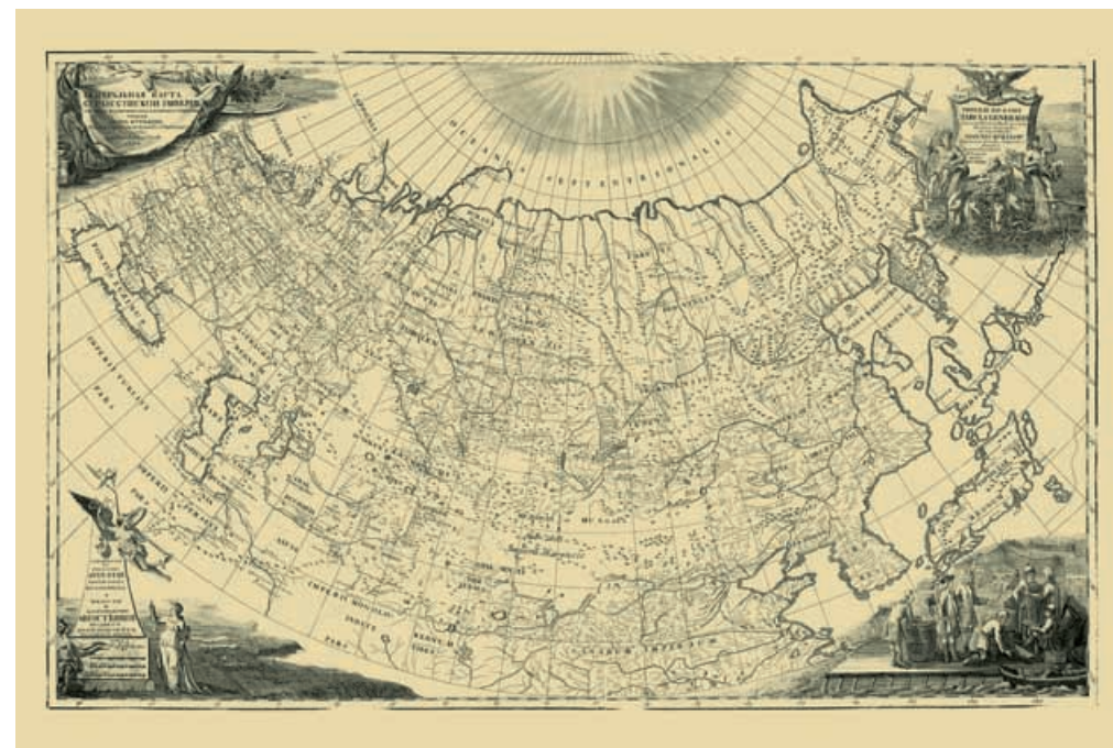
Генеральная карта Российской империи, 1734 г. Первая отечественная карта, на которой дано изображение всей территории Российской империи — от Европейской части до Камчатки.

Сначала работа Кирилова продвигалась достаточно успешно, но вскоре ему стало ясно, что осуществить задуманное