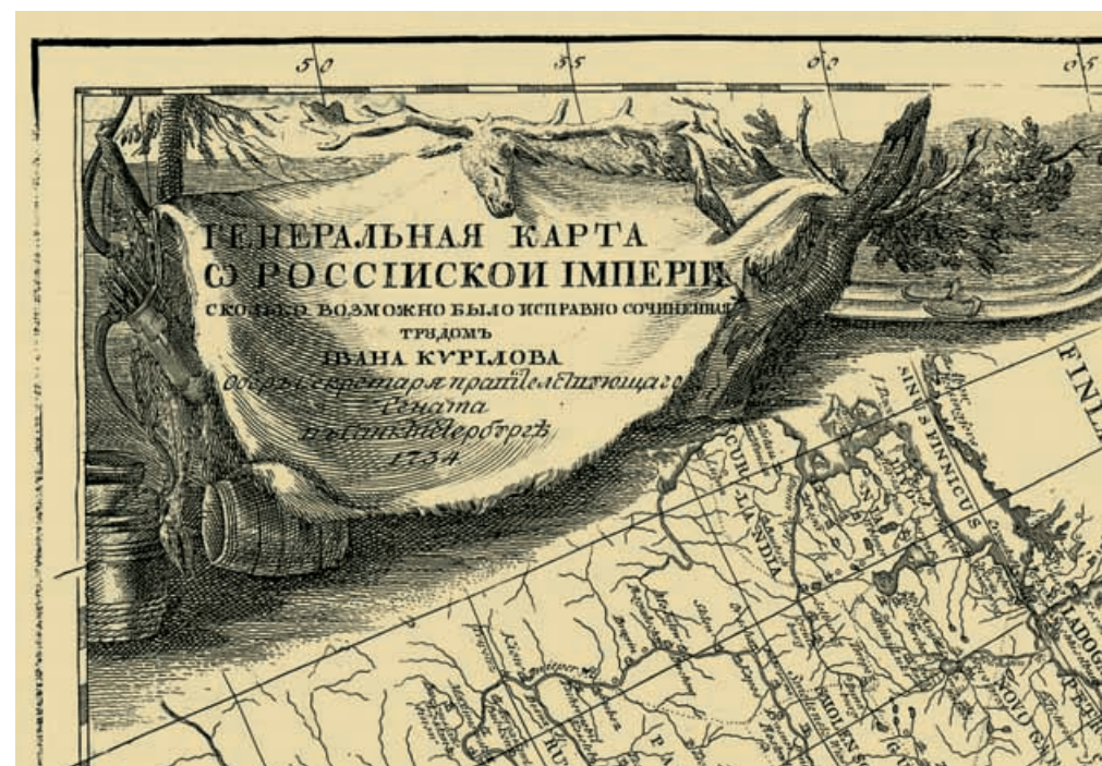
Титул Генеральной карты Российской империи (1734 г.).