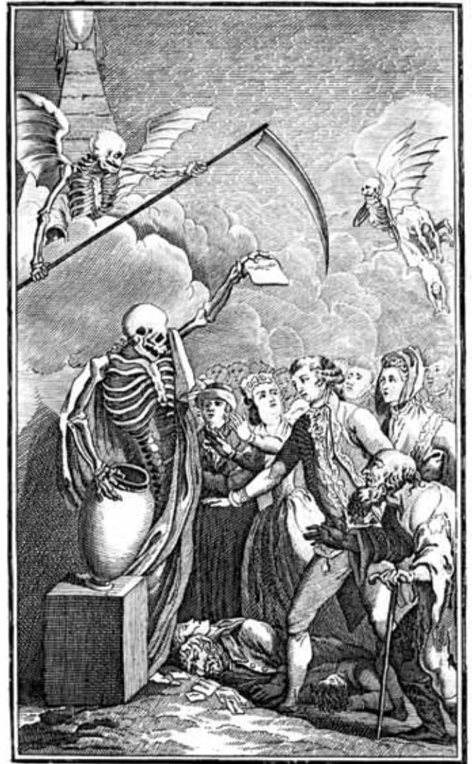
Безжалостная смерть всё коситъ племена;— И въ урну смертныхъ всѣхъ собираваетъ имена! Часть 1. стр. 204.

В России первые ложи появились в 1740-х годах. Они отличались пышными ритуалами, благотворительной деятельностью, строгой и сложной иерархией. Самый яркий период масонского «рыцарства» начался в 1776 году, когда в Швеции был посвящен в высшие степени князь А.Б. Куракин. Членами лож становились люди, составлявшие цвет и славу российского дворянства. Русских идеалистов привлекало изображение деятельности масонства на западе как высокий порыв к свету, добродетели, истине... Некоторые исследователи архивных материалов считали масонство первопричиной возникновения всех тай-