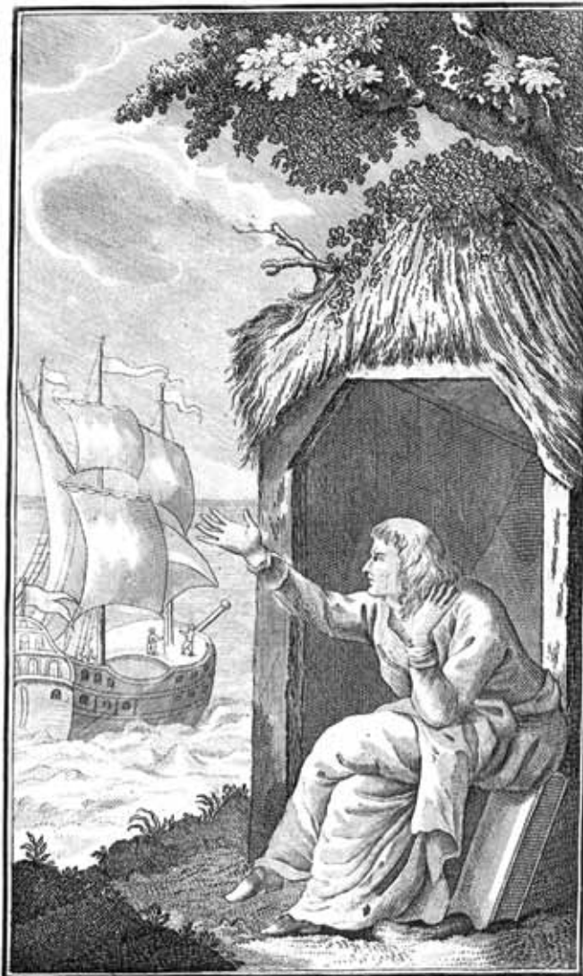
Вселения корабль; заботы жизни, море; ... Волею в ней мы зримь опасности и горе. Чтение I. стр. 129.