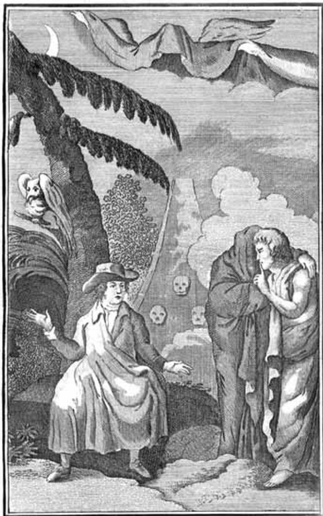
Союзная тема! Нощная Спутница, покой и тьмота. Часть 1. стр. 6.

в XIX веке. Новый его всплеск в России наблюдается с 1970-х годов и продолжает нарастать. Выпущено много современных изданий, но ощущается явный недостаток в документально обоснованных исследованиях. Большая часть академических работ по истории масонства была создана до 1917 года.