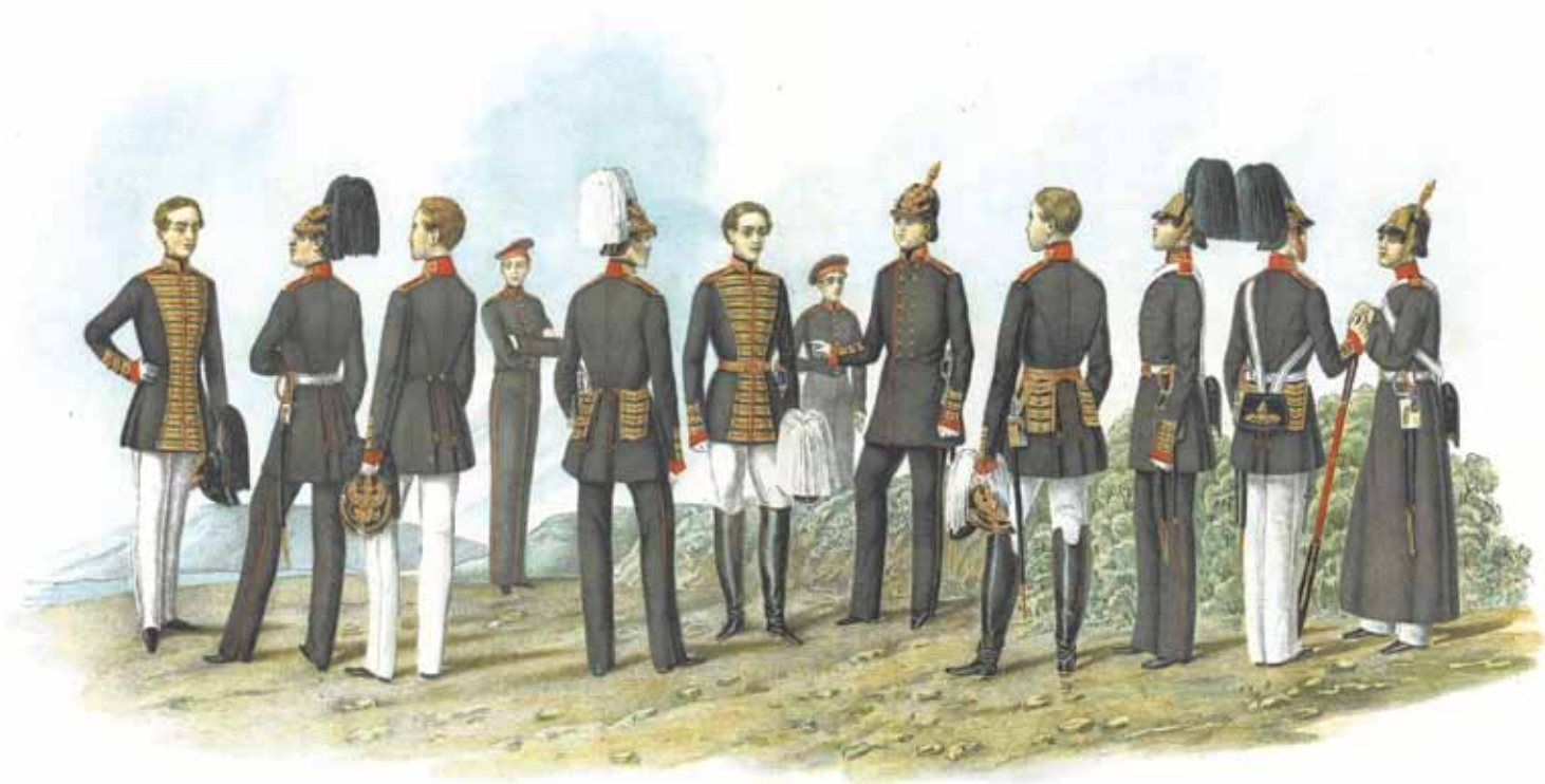
Формы одежды камеръ-пажей и пажей в 1855 году.

В центре Петербурга, близ Невского проспекта, рядом с Императорской публичной библиотекой сквозь строгую чугунную ограду просматривается старинный дворец. Замечаешь некую недоступность и даже таинственность, от него исходит дух места и времени. Это дворец графа М.И. Воронцова – канцлера Российской империи, памятник архитектуры XVIII века, построенный в 1749–1757 годах по проекту Ф.Б. Растрелли. Во времена правления императора Павла I, принявшего вскоре после вступления на престол титул Великого магистра ордена Святого Иоанна Иерусалимского (Мальтийского ордена), во дворце с 1798 по 1801 год размещался Капитул ордена. В 1800 году на территории дворца была выстроена Римско-католическая церковь Святого Иоанна Крестителя (Мальтийская капелла), архитектор Дж. Кваренги, а в помещении дворца в 1801 году для православных пажей и персон корпуса – православная церковь Святого Иоанна Предтечи. В 1810 году один из владельцев пе-