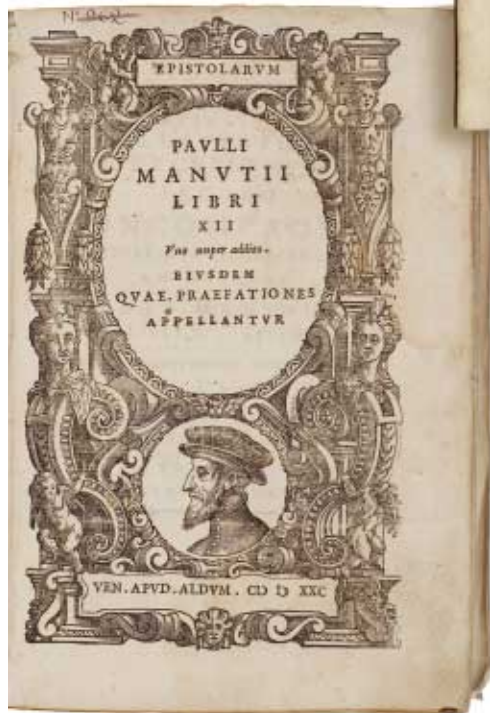
Издание писем Павла Мануция (Венеция), 1580, тит. л. с портретом автора.

Шрифты являют собой отдельную тему для исследователей, а для ценителей — повод для восхищения. Альд Мануций не был ни художником, ни гравёром. Шрифты для его книг создавал выдающийся гравёр-пуансонист Франческо Гриффо. Отлитые литеры и матрицы, а в некоторых случаях и пуансоны изда-