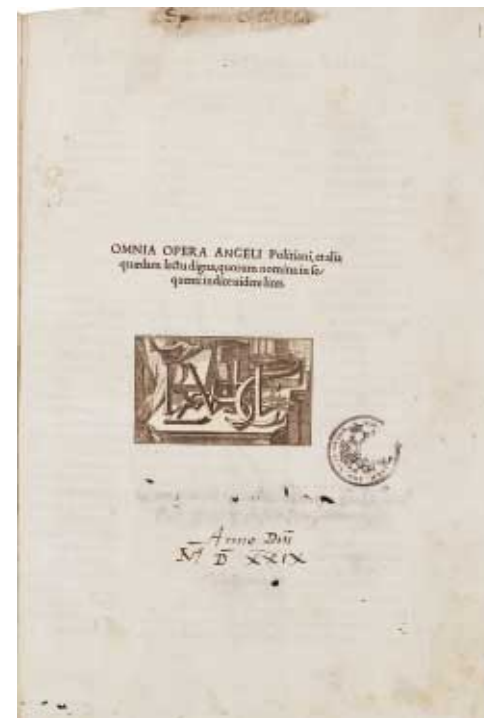
Типульный лист издания Omnia opera Angeli Politiani... Venetiis, in aedibus Aldi Romani, VII, 1498

ли, по меткому замечанию одного из исследователей, «как внутренние достоинства, так и внешнее изящество».