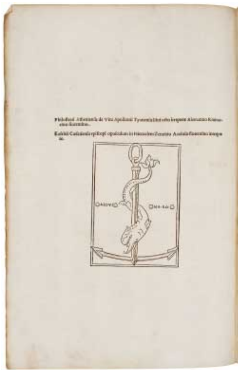
Типографская марка в конце издания Philostrati de vita Apollonii Tyaneae... Venetiis, apud Aldum, II, 1502.