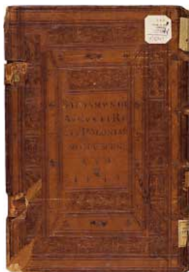
Нижняя крышка переплета издания Simplicii Commentarii in tres libros Aristotelis... Venetiis, in aedibus Aldi et Andreae Asulani Soceri, 1527.

Подбор бумаги, дизайн обложки и подготовка к печати были выполнены издательством «Альфарет». 10