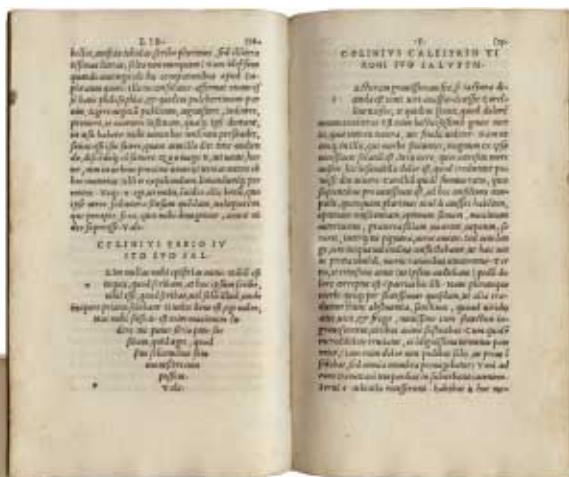
Разворот издания Plinii Secundi Novocomensis epistolarum libri decem... Venetiis, in aedibus Aldi et Andreae Asulani Soceri, XI, 1508.

тель покупал у Гриффо, и они становились его собственностью. В итоге Альд Мануций смог выработать стиль, органично соответствующий издаваемой им литературе. In aedibus Aldi пристальное внимание уделялось каждой составляющей книги: часть тиража, к примеру, могла печататься на более дорогой бумаге.