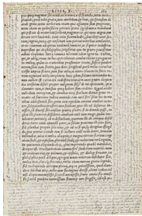
Пометы на экземпляре издания M. Fabii Quintiliani Institutionum oratoriarum libri XII... Venetiis, in aedibus Aldi, et Andreae Soceri, I, 1521.