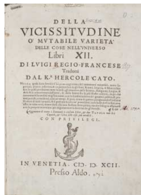
Титульный лист издания Della Vicissitudine o mutabile varietà delle cose nell'universo Libri XII. Di Luigi Regio francese tradotti dal K-r Hercole Cati, Venetia, presso Aldo, 1592.

Собрание «альдин» Библиотеки Российской академии наук невелико: из 245 описанных экземпляров (включая дубликаты) 42 «альдины» были выпущены Альдом до объединения с типографией Андреа д'Азола. Наиболее ранней «альди-