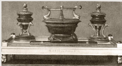
Стол в кабинете великой княгини Марии Федоровны в Большом Павловском дворце. Т. 2. После с. 472

кает к себе внимание использованием многочисленных исторических источников и литературы. Бесценным является подробное описание отдельных архитектурных деталей и интерьеров, а также иллюстративный материал —