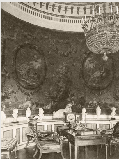
Павловск. Библиотека великой княгини Марии Федоровны. Gobелены по рисунку Буше, стол Рентгена. Т. 2. После с. 428

Книга выделяется прекрасным стилем изложения материала и привле-