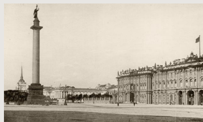
Гр. Растрелли-младший. Часть Зимнего дворца со стороны Дворцовой площади. Т. 1. После с. 36. Растрелли-младший. Часть Зимнего дворца со стороны Дворцовой площади. Т. 1. После с. 36

Во второй том вошли описания загородных ансамблей, расположенных