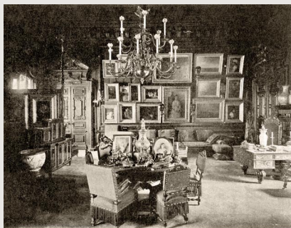
Аничков дворец. Кабинет императора Александра III. Т. 1. После с. 326.