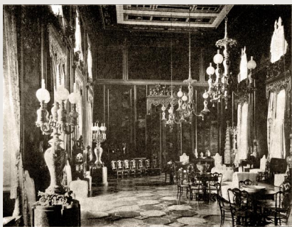
Большой Царскосельский дворец. Китайская комната. Т. 2. После стр. 373.