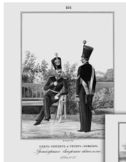
Обер-офицер и унтер-офицер Гренадерского Саперного батальона, форма образца 1833–1834 годов.