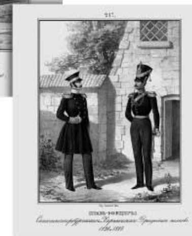
Штаб-офицеры Санкт-Петербургского и Харьковского Драгунских полков, форма образца 1826–1827 годов.